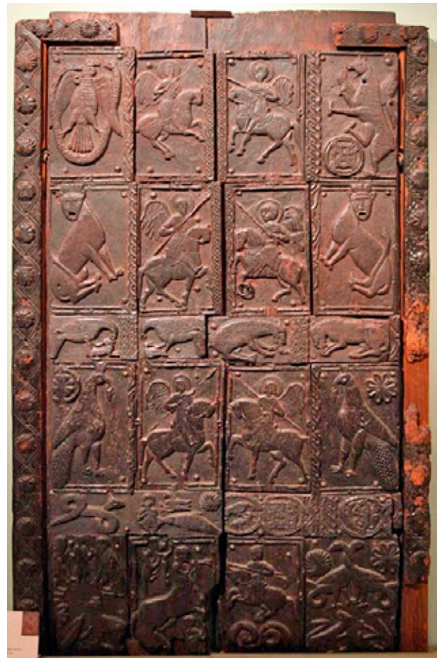
fig.9 wooden door from St. Nicholas of Hospitality, Ohrid, Sofia National History Museum, 14th C. сл.9 дрвената врата на Св. Никола Болнички, Охрид, Национален Историски Музеј, Софија, 14 век