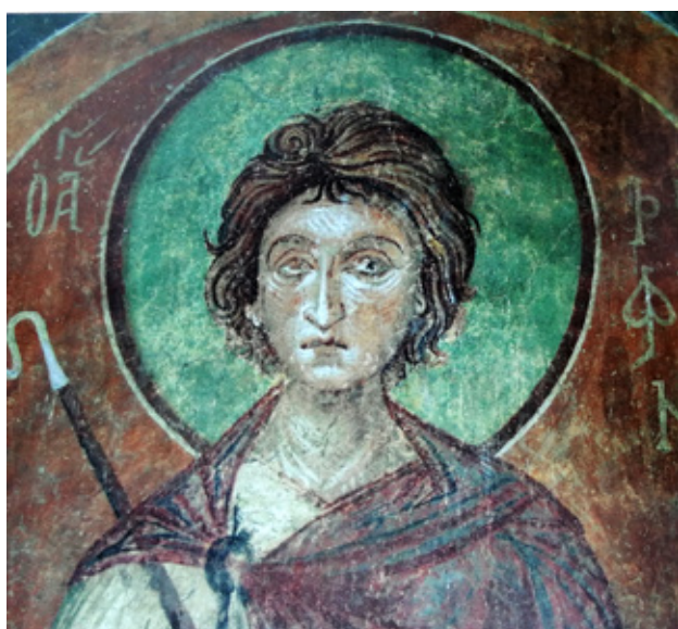
fig. 1 St. Triphon, St. Panteleimon, Nerezi, 1164, example of Classic beauty and Antique modelation, announcing Renaissance art

Keywords: Iconography issues, terminology, art history, circulation of models and ideas, Medieval art, Byzantine Empire, Byzantium, Medieval Macedonian art