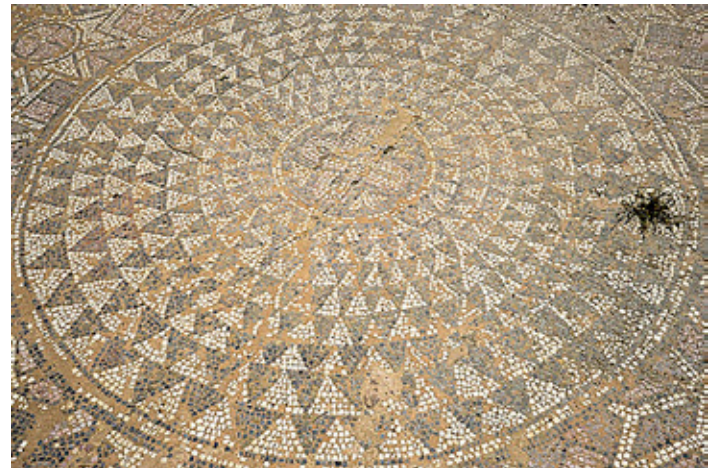
fig. 7 Solomon sign, Heraclea early Christian mosaic

сл. 6. Куклион зад апсидата на новата голема базилика во Коњух