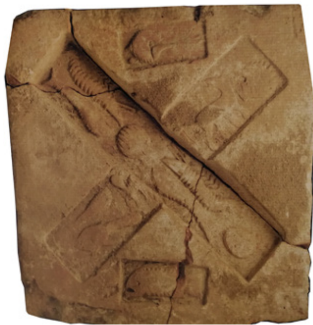
fig. 5. Ceramic plate with representation of St. Andrew cross filled with fishes, lamb and sea animals from Vinica сл. 8. Рељефна плоча со претстава на Андреев крст исполнет со риби, јагне и морски животни, Виница

Balkan region came from may be answered by collecting data on new findings and research of the Eastern parts of Byzantium. Some scholars think it was influence from the embroidery, popular for the nobility at the time and later. Yet, the death of Tsar Samuel was not instant, there was enough time to prepare and use symbols directed by his choice.