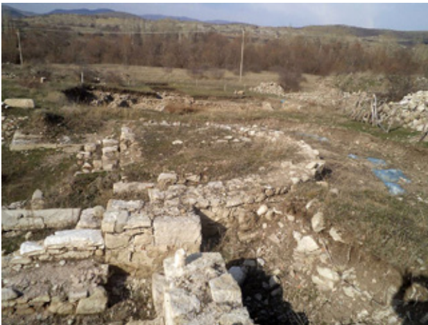
fig. 6 Kuklion behind the apse wall of the new large Early Christian basilica in Konjuh

сл. 6. Куклион зад апсидата на новата голема базилика во Коњух