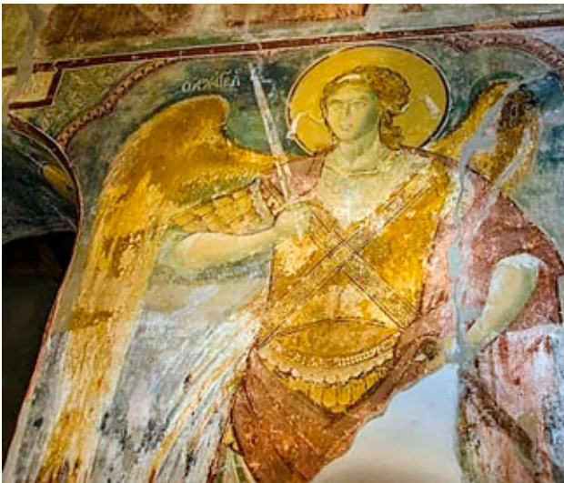
fig. 2 Holy Archangel, from St. Nicholas, Mariovo, 1271, example of Classic beauty and Antique modelation, announcing Renaissance art

сл. 2. Архангел, Св. Никола, Мариово, пример на класична убавина, и античка моделирања, најавна на ренесансната уметност