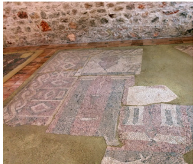
fig. 3. Early Christian Basilica in the village Oktisi, Struga, mosaic

сл. 3. Ранохристијанска базилика во село Октиси, Струга, мозаик