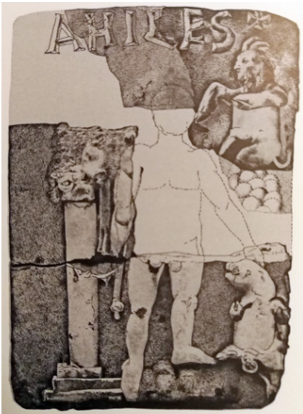
fig. 4. Ceramic plate with representation of Achilles, from Vinica

Who were the artists that made the tsar Samuel pseudo sarcophagus at St. Achill, Prespa and where did the motif of a camel and birds not native to the