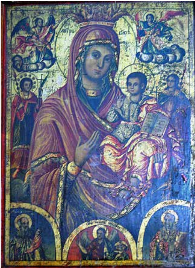
Сл.16. Св. Богородица со светители, автор Димитрија Крстевич - Дичо зограф

Живоносен источник – Балаклија, Св Богородица со Христос и светителите св. Стилијан, Св. Никола и св. Јован, Првиот Вселенски Собор и Преполовение со сцени: Мироносници на гробот Христов, Исцелување на раслабениот, Христос и Самарјанката и Исцеление на слепородениот.