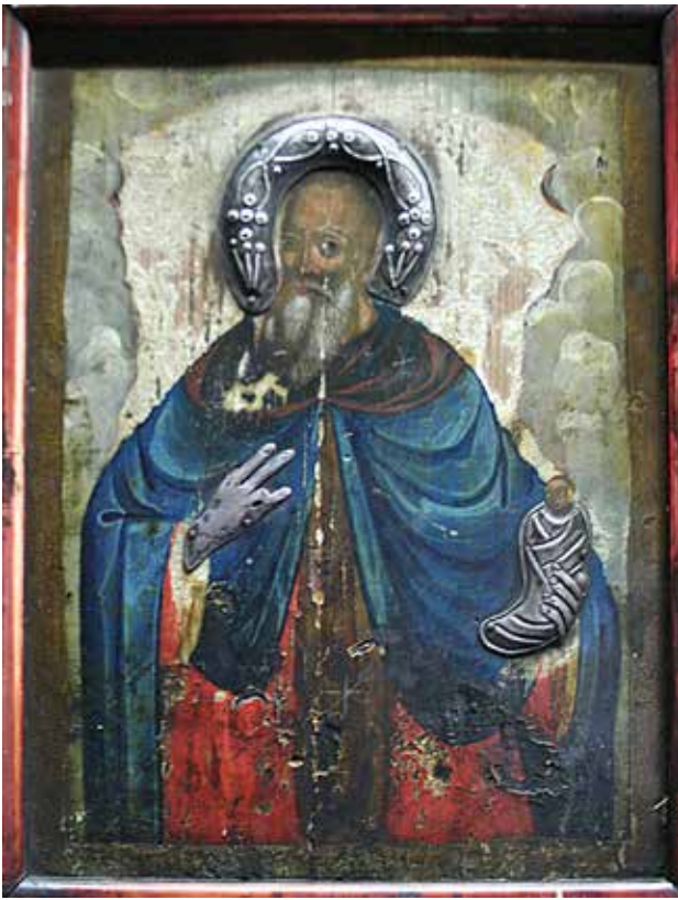
Сл.20. Св. Стилијан, автор зограф Хаџи Косте (Костадин) Крстев

меѓу зографите. 67 Оставил многубројни дела во цркви во Македонија, а сликал и во црквите на Рашко-призренската епархија. 68