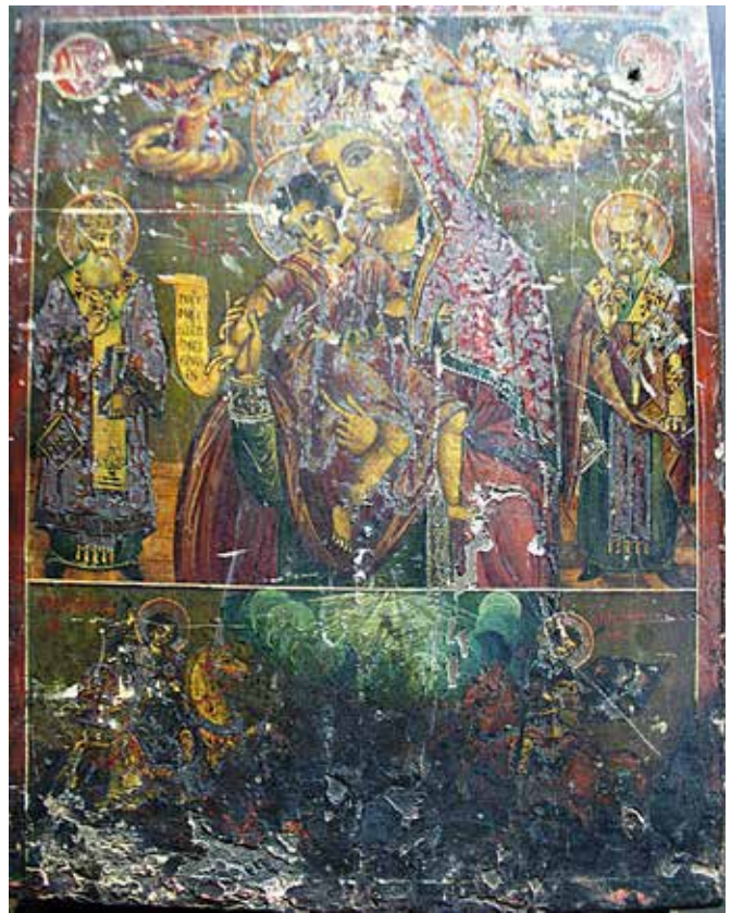
Сл.6. Св. Богородица Елеуса Кикоска и светители, зограф Крсте од Велес, прва половина на XIX век

точка, која задолжително е сликана и на брадата на светителите. На иконите слика мноштво бели облаци во топчести форми, кои ги следиме и на иконите Апостол Петар и Павле (1818), Слегување на Светиот Дух (1818), двете икони Успение на Богородица (1818 и 1819) во збирката на Музеј на РС Македонија. Ликовите на св Ана и помошничките се идентични со претставата на св. Богородица од композицијата „Благовештение“, втора деценија на XIX век од црквата Св. Богородица во Дебар. 31 Во десниот агол на зелена основа е испишан донаторскиот натпис: ПОМАНИ ГДИ РАБА ТВОЕГО ГРЕШНАГО .....СЦА ЕГО КОСТАДИНА.