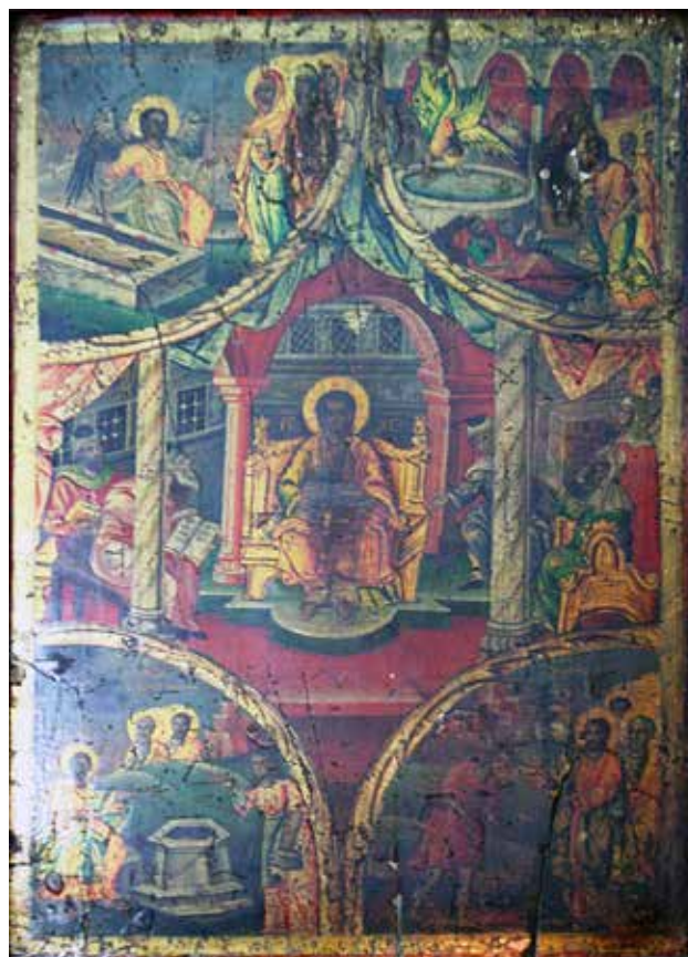
Сл.19 Празник - Преполовение, автор Димитрија Крстевич - Дичо зограф

е претставена сцената Христос го исцелува слепородениот. На улица слепородениот стои пред Христос кој со десната рака го допира за окото, во позадина се апостолите (Јн.9,1-14). 64 Сцените се доведуваат во врска со исцелителните води на изворот / бањата Силоам / испратен (Ис.12,3), односно за симболичното значење на целокупната претстава во оваа икона која се доведува во врска на доаѓањето на Месијата кого Отецот го испраќа да го спаси светот.