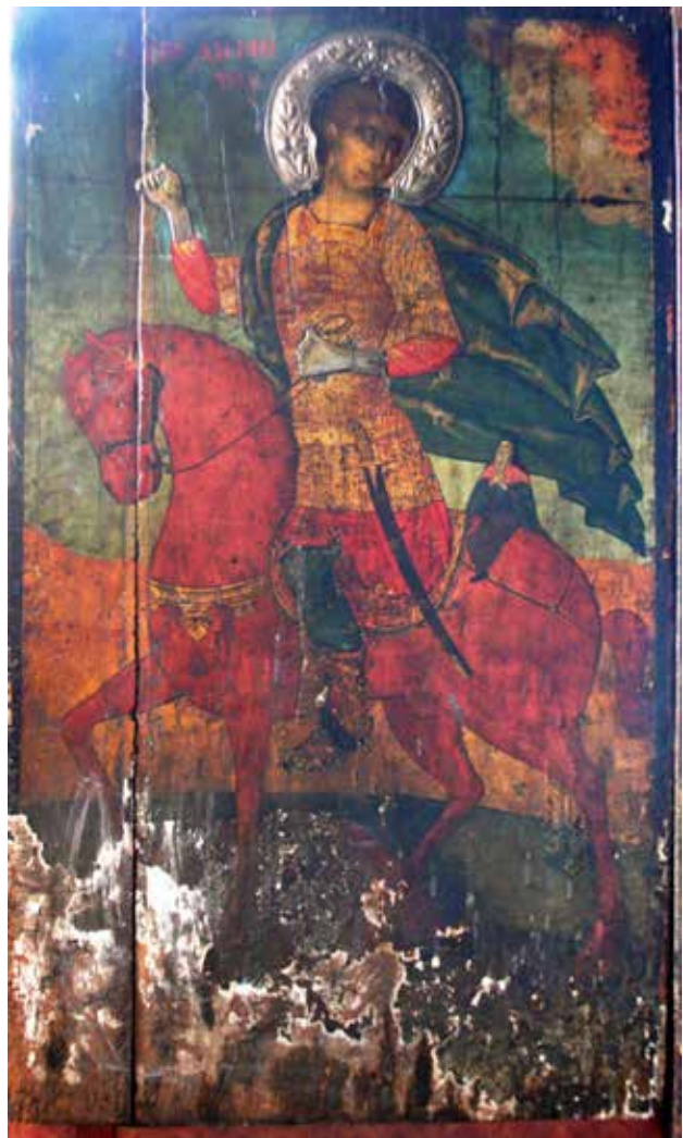
Сл.1.Св. Димитриј го ослободува епископот Кипријан од ропство, непознат зограф, охридска непознат зограф, охридска пробарокна школа, втора половина на XVIII век

Втората икона slikана од непознат автор од истата охридска сликарска школа, во техниката темпера на штица, е посветена на еден од четворицата големи пророци, Св. пророк Данил со сцени од неговото житие (Сл.2). 19 Сигнатурата е изведена со црвена боја во висина на ореолот ( СПРОКЪ ДАНИЛЪ ). Св. пророк Данил е претставен фронтално во цел раст, под арка (во ковчеже). Млад, со куса коса завртена зад ушите, со фригиска капа на главата. Носи долга црвена туника и над неа куса зелена туника по рабовите украсени со златни ленти. Пророкот е нагрнат со црвена наметка која ја покрива левата рака. Десната рака во висина на градите е отворена нанапред, а во левата држи отворен свиток со натпис во 7 реда: Ѣ тебе горо Ѣсечеса каменъ без рѣкъъ человечески, (се одвои камен од гората без човечки раце) (Дан.6.17). Станува збор за сцената - пророкот Данил го толкува сонот на царот Набукодоносор (Дан. 2. 31- 45). Натписот на свитокот за каменот