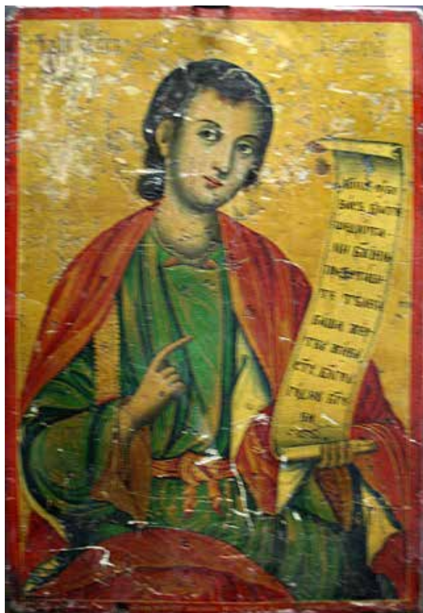
Сл.15. Св. апостол Тома, автор Димитрија Крстевич - Дичо Зограф, 1860 год.

ни, иконите се исполнети со мноштво фигури, впечатлива архитектура и пејсаж во заднината на сцените. Иконите најверојатно се сликани во времето на неговиот престој и работа во Скопје во 1860 година, по неговото враќање од Врање.