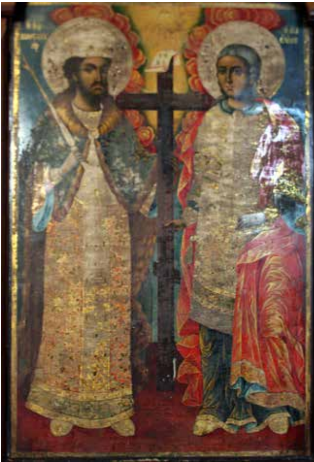
Сл.8. Св.св. Константин и Елена, непознат самоковски автор, 1847 г.

од 1847 година (Сл.8). 37 Првиот христијански цар св. Константин и неговата мајка св. Елена, секогаш се прикажани заедно, со Чесниот крст помеѓу нив, кој според преданието е најден на Голгота во присуство на царица Елена. 38 Десно од крстот стои цар Константин царь Константиъ , со куса кафена брада и долга кадрава коса која се спушта низ рамената. Претставен со инсигниите на неговото царско достоинство, висока круна на главата, скиптар во десната рака. Облечен во резеда долна туника со цветна декорација, врз која носи златен сакос со црвена цветна декорација, златен лорос и син огртач поставен со крзно под брадата закопчан со цветна аграф. Св. Царица Елена царица Елена , седа старица, носи долг син фустан, врз него куса златна туника, нагрната со црвена со сино поставена наметка, во левата рака држи скиптар.