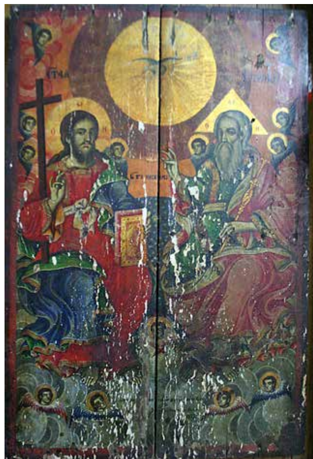
Сл.9. Св.Троица,темпера на даска, 1871 год., автори Вангел со браќата Никола, Коста и Атанас од Крушево

Исус Христос Седржител (Сл.11), на иконата сликана во син хитон и црвен химатион со златни