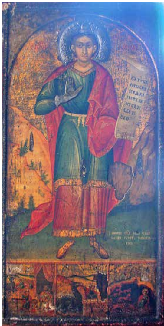
Сл.2. Св. пр. Данил и сцени од неговото житие, непознат зограф, охридска пробарокна школа, 1785 год

поле е претставено паднато дрво и Набукодоносор претворен во животно кое јаде трева, казнет поради неговата лошотија. А заради пророштвото за падот на Вавилонското царство и доаѓањето на вечното Божје царство, пророкот Данил е фрлен во пештера со седум лавови, сцената е сликана во третото поле. Пророкот Данил останува неповреден. И третата сцена исто така е старозаветна префигурација на Богородица (Дан 6.16). 20 Пророчката (фригиска) капа, ореолот и десната дланка се изведени во сребрен опков. Натпис во долниот лев агол со бела боја поменѝ гдѝ нашъ сѣѝа ѿвѝце рѝфѝтеѝ сѝпѝнѝѝѝски 1785., открива дека иконата ја дарувале членовите од сапунѝскиот еснаф. Ктисторството е колективно. Вообичаено во тој период зографите сликале според вкусот на дарителите, главно богати трговци, занаетѝски еснафи. Пророштвото на Данил за пропаста на Вавилонско-