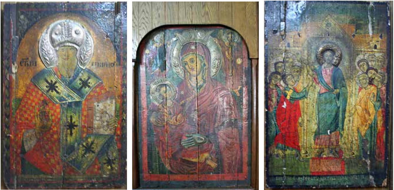
Сл 3-5. Св. Спиридон, 1800 година, и Св. Богородица со Христос, Неверувањето на апостол Тома, крај на XVIII и поч. на XIX век, автор зограф Јереј Петар

посветена на Св. Спиридон (СВЪИ СПИРІДСОНЪ) (Сл.3). Иконата е сместена во ковчеже. 24 Светителот е претставен како архиереј, со долга седа брада и мустаки, очи со нагласени подоклици. Неговиот саκος е сликан со шаховска декорација од црвени и жолти коцки. Зелено маслинестиот омофор е декориран со црни крстови. Со десната рака благословува во левата држи евангелие. Цртежот е нагласен со тенки потези со црна боја. Ореолот и камилавката се кујунциска изработка од ковано сребро.