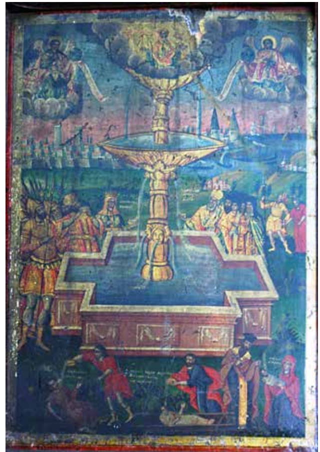
Сл.17. Св. Богородица живоносен источник, автор Димитрија Крстевич - Дичо зограф

гословува. Св. Стилијан е заштитник на децата и бездетни родители, стар прокелав со седа коса и брада, носи темнозелена мантија. На средината е претставен крилатиот св. Јован Крстител од иконографскиот тип кефалофорос со отсечената глава на тацна во левата рака, со десната во став на благослов. Облечен во кафен мелот, нагрнат со темнозелена наметка. Во левиот агол е претставен св. Никола кој со десната рака благословува, а во левата држи затворено евангелие. Врз зелената туника носи црвен химатион од цветно декориран бродат, зелен омофор.