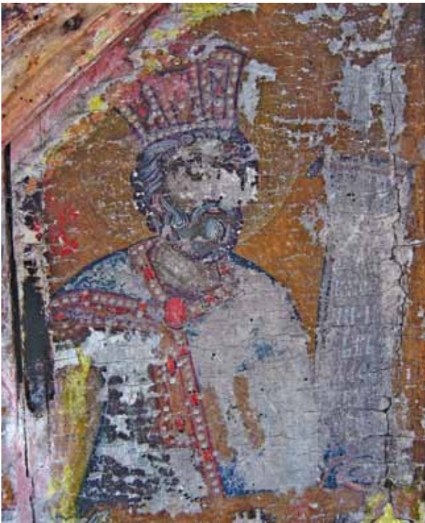
Сл. 8. Пророк Давид, пред конзервацијата, детал Fig. 8. Prophet David, before conservation, detail

на Богородица, во чија заднина се гледаат архитектонски зданија и над нив полуфигурите на пророците Давид и Соломон, како составен дел на темата.