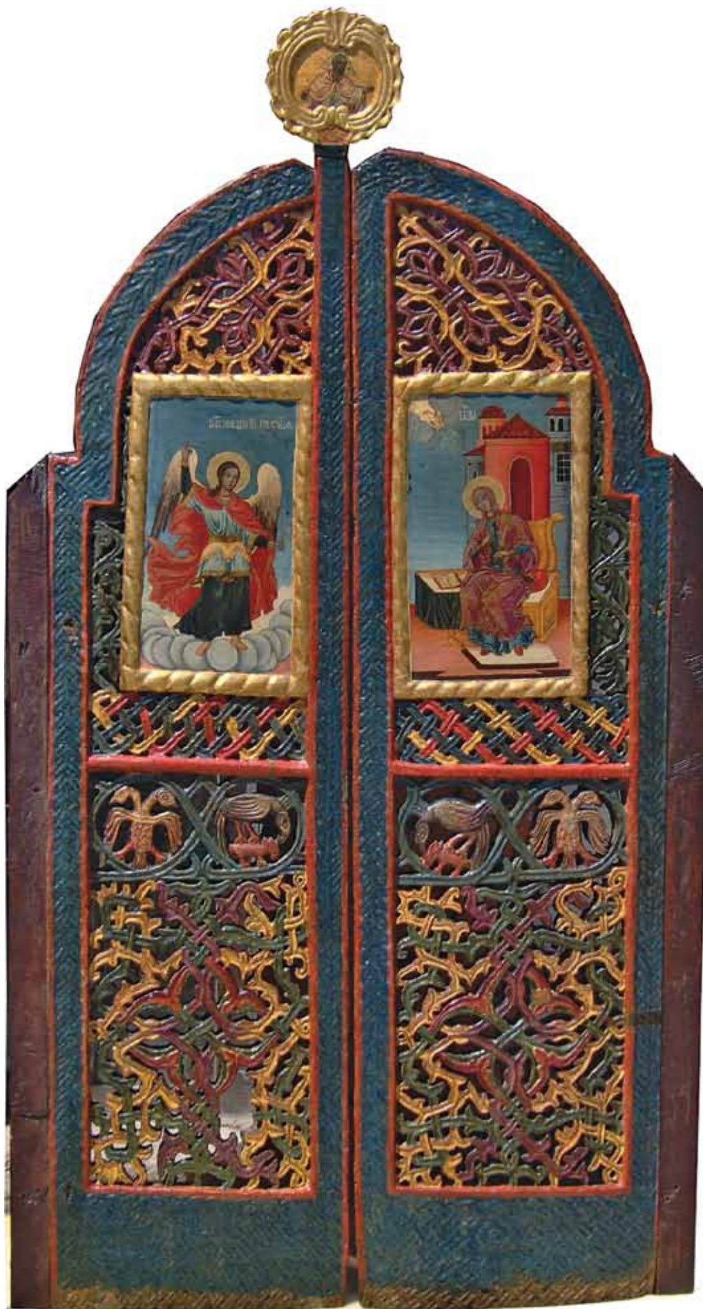
Сл. 1. Царски двери од црквата Св. Никола во Крайово, по конзервацијата Fig. 1. Royal Doors, church St. Nicholas, Kratovo, after conservation