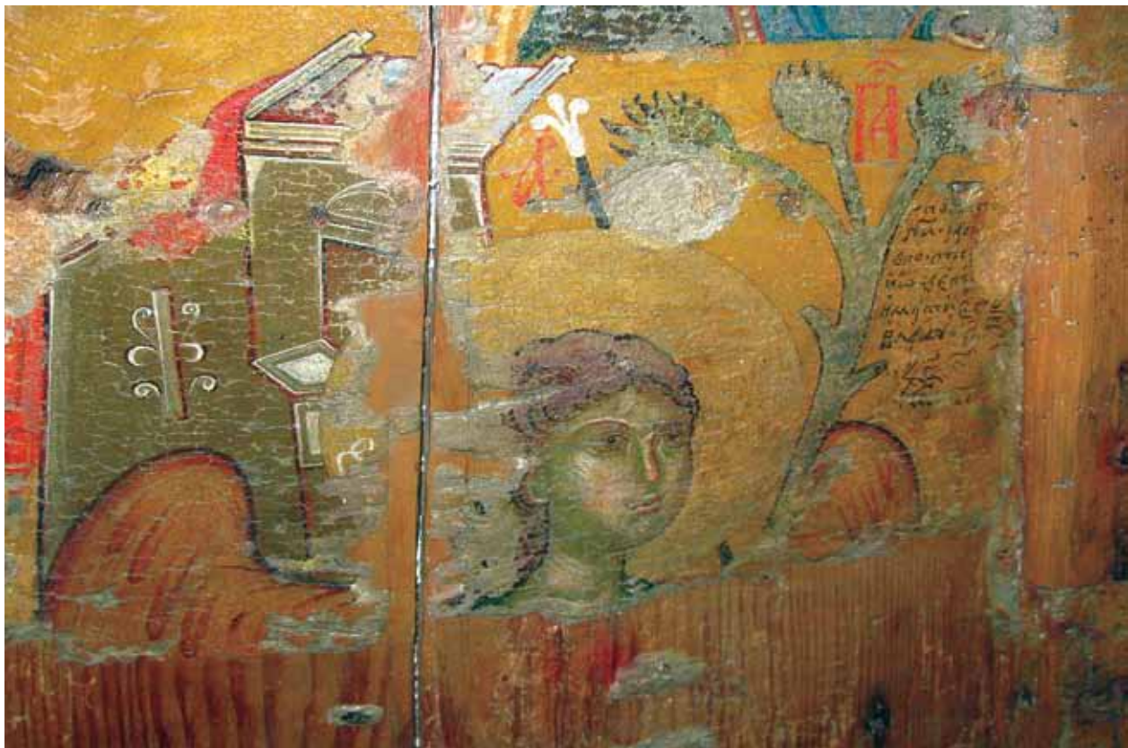
Сл. 6. Архангел Гаврил, детал Fig.6. Archangel Gabriel, detail

испишани со црвена боја, текстот од свитокот на Давид со бела боја, а текстот од свитокот на Соломон со црна.