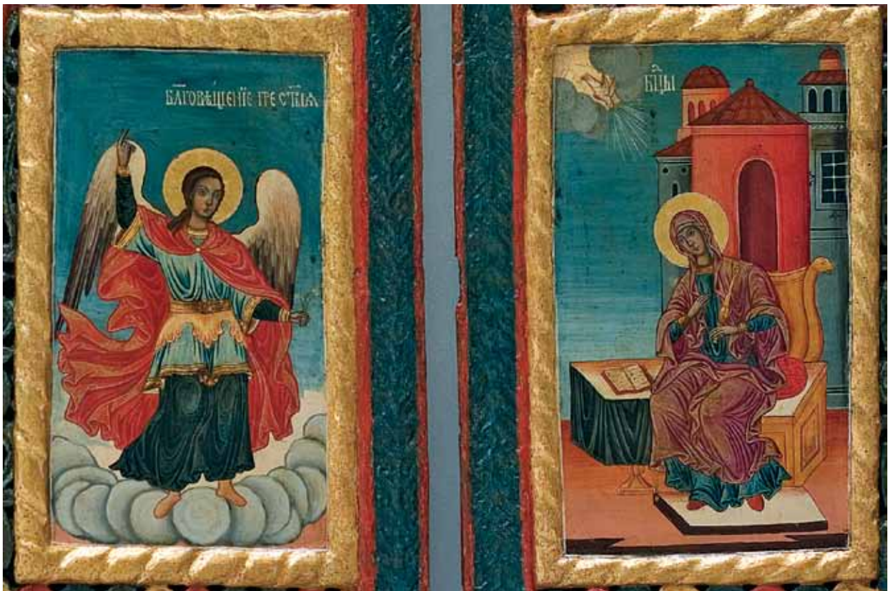
Сл. 3 Благовештение Fig.3. Annunciation

работени во површинска плитка резба чија компактност им дава извесна цврстина на дверите. На највисокиот полукружен дел од крилата на дверите се издига слободно режан медалјон во вид на стилизиран цвет со кус држач, чијашто сликана површина е покриена со жолта боја. 13