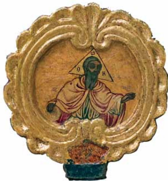
Сл. 2. Резбарен медаљон со Госјод Саваоџ, по конзервацијата