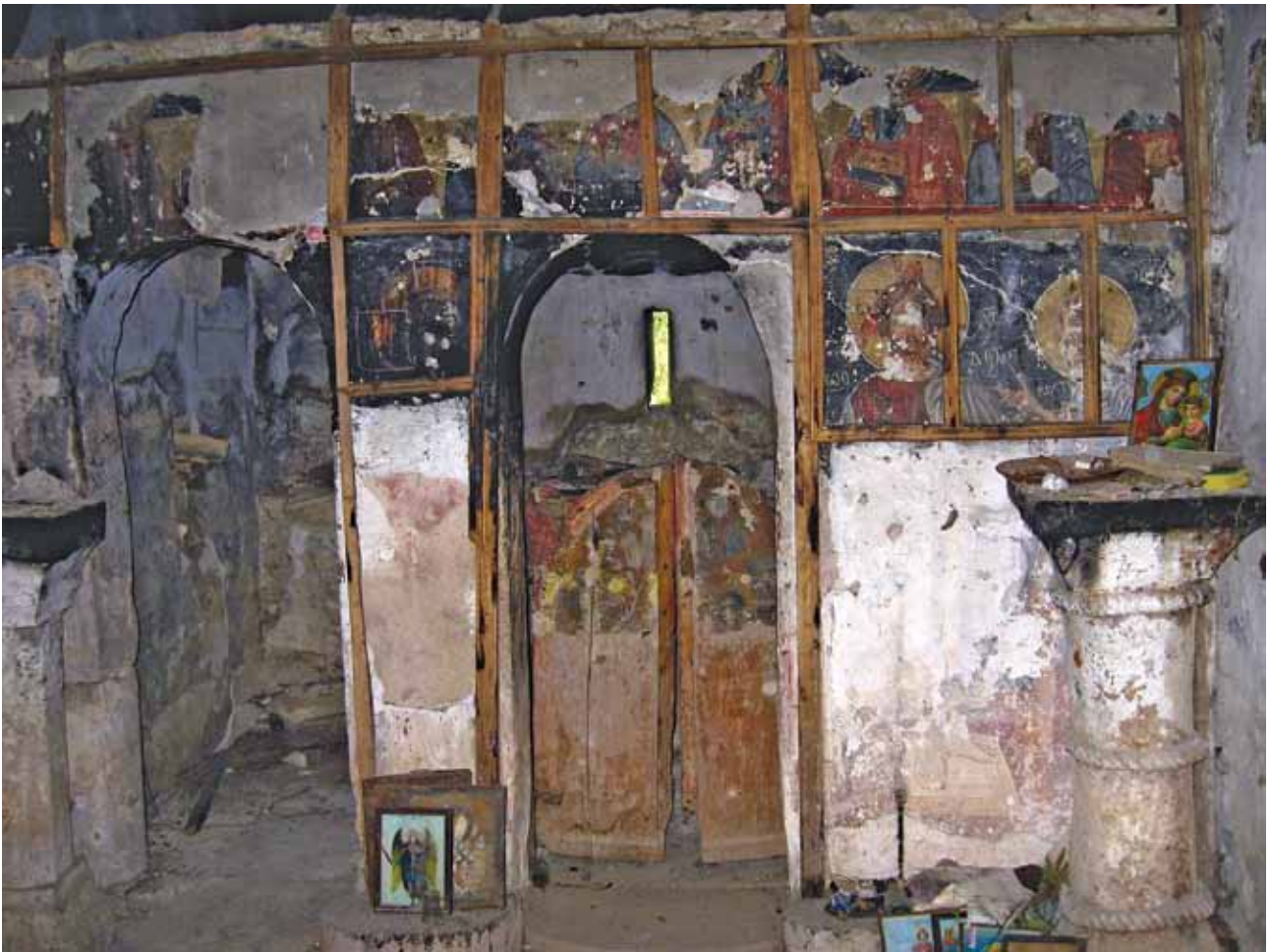
Сл. 4 Изглед на сиданиот иконостас во Шојско Рударе Fig.4. View of the built iconostasis, Shopsko Rudare