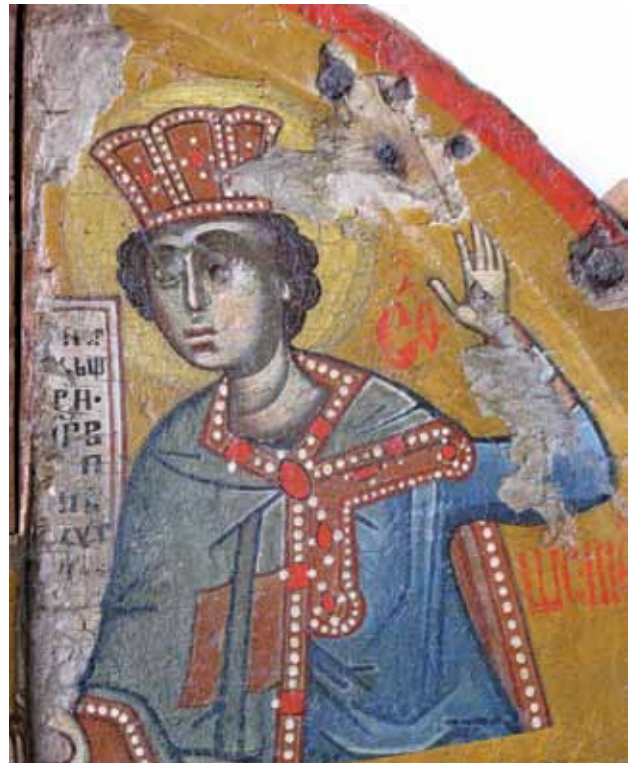
Сл. 9. Пророк Соломон, детал Fig. 9. Prophet Solomon, detail

вото пророштво. 28 Десната рака со отворена дланка му е подигната до висина на главата, врз која има отворена бисерна круна. Сината наметка му е бордирана со бисери и скапоцени камења, фатена на градите со црвена аграф. Белата, благо брановидна коса му е зачешплана зад ушите, а врз челото обликувана во вид на кадрици. Тркалезната брада и мустаците го заокружуваат долниот дел од убаво формираното лице на кое се истакнуваат широко отворени очи, одлучно стегнати усни и правилен нос.