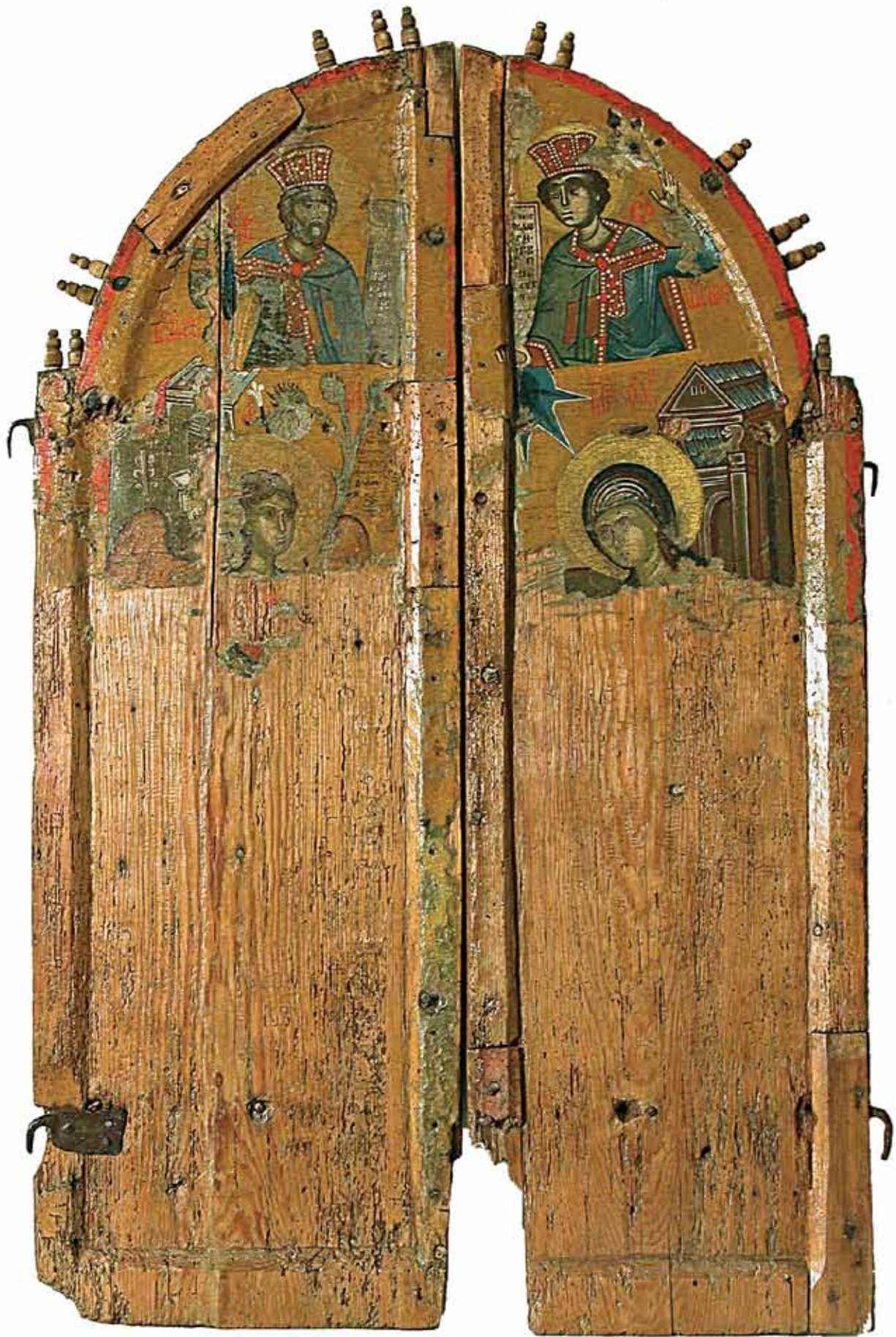
Сл. 5 Царски двери со сликано Благовештение Fig.5. Royal Doors with the painted Annunciation