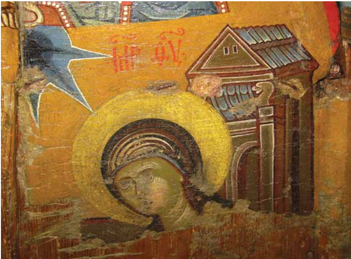
Сл. 7 Богородица, детал Fig.7. The Holy Virgin, detail

зентативниот примерок од Нерези. 33 Дверите од Шопско Рударе ѝ припаѓаат на една друга група, со целосно исликана предна страна, што е повеќе карактеристично за втората половина на XVI век. 34 Единствениот украсен елемент изработен во дрво биле токарените столпчиња распоредени по работ на заоблената горна површина.