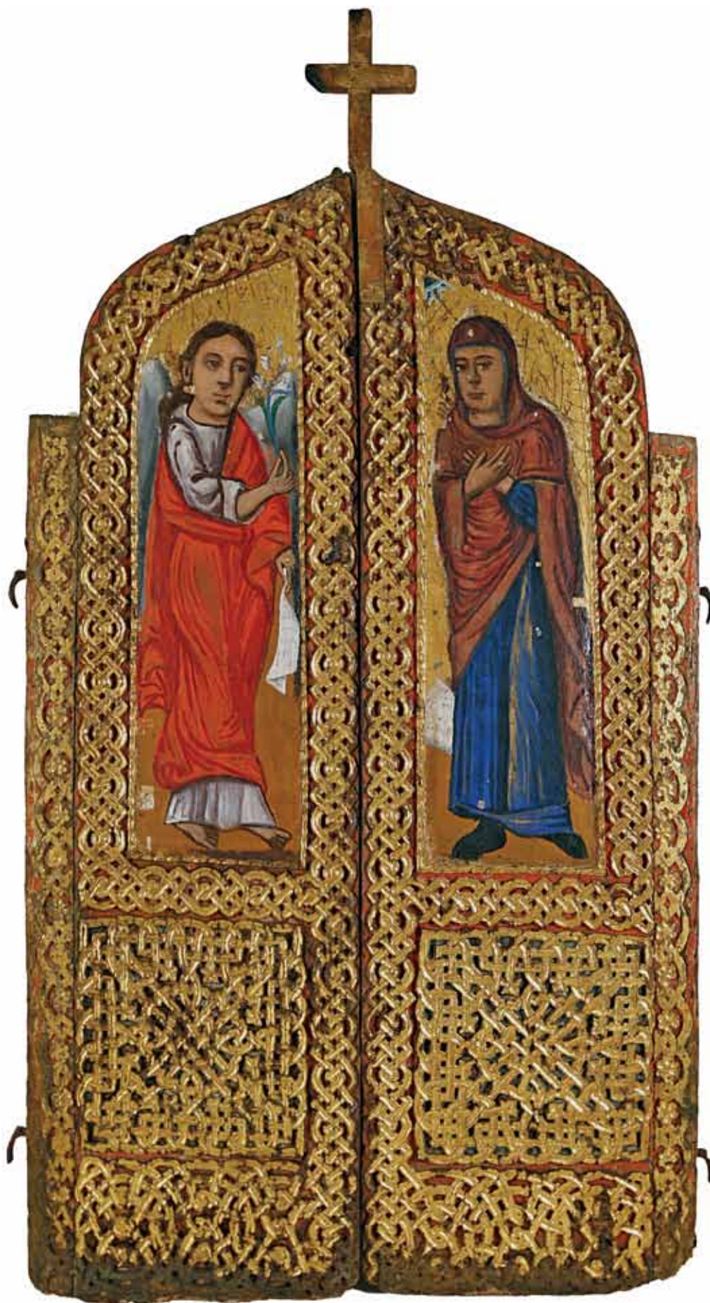
Сл. 10. Царски двери од Орах, по конзервацијата Fig.10. Royal Doors, Orah, after conservation