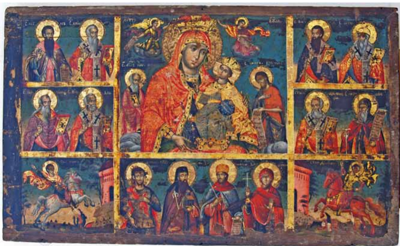
сл. 10 Богородица со Христос и светители, околу 1827 г., икона во приватна сопственост