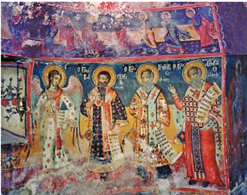
сл.2 Поклонување на Агнецот, олтарна апсида на цр. Свето Преображение, Самарина, 1819, детаљ