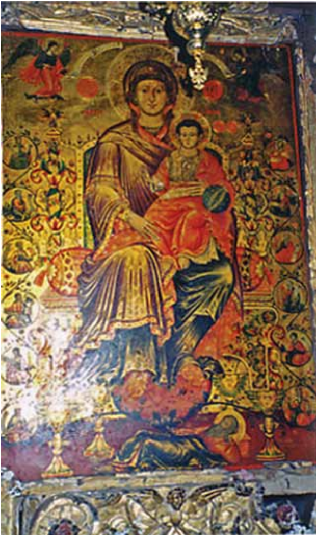
сл. 3 Богородица со Исус Христос, 1815 г., престолна икона од цр. Свето Преображение, Самарина