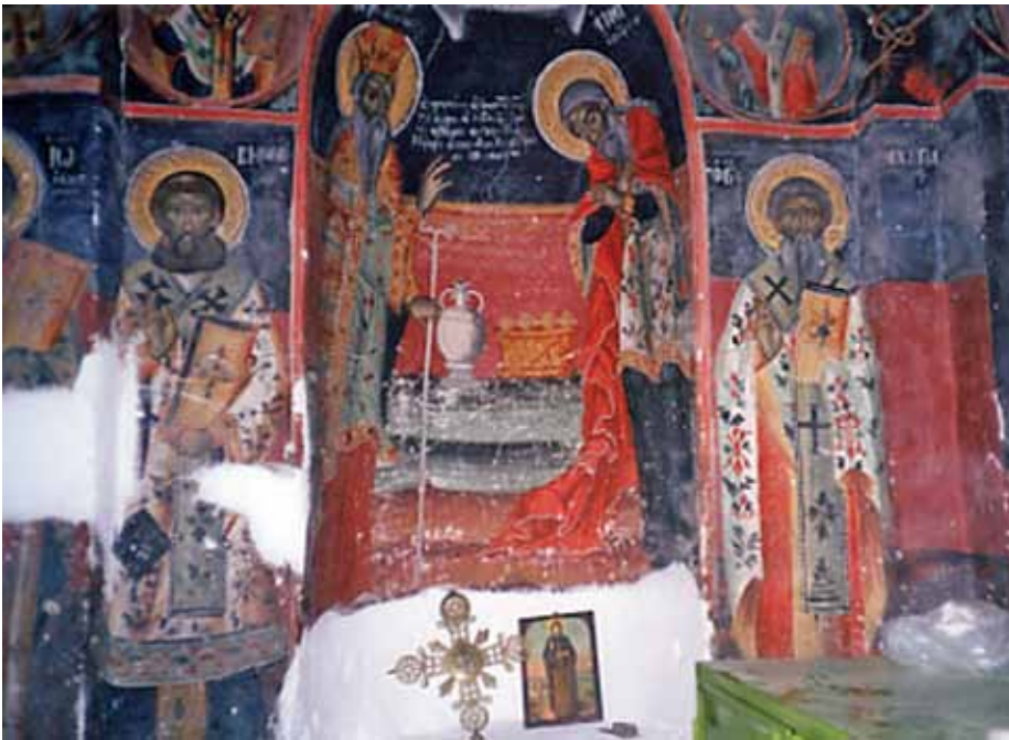
сл. 1 Живопис во факоникон на цр. Св. Параскева, Самарина