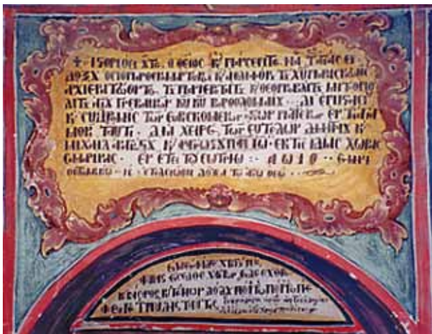
сл. 5 Натпис над влезната врата во наосот на цр. Свето Преображение, Самарина

промоција на зографот пред двајцата влијателни црковни лица за добивање работа. Идентичниот потпис само уште на едно дело, подоцнежната икона од с. Подвис, веројатно е „потсетување” на некогашната функција, а не и активно продолжување со истата.