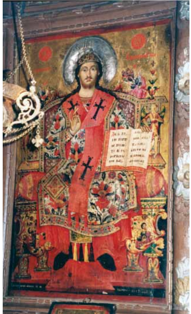
сл.4 Исус Христос Велики архијереј, 1817 г., престолна икона од цр. Св. Параскева, с. Коница