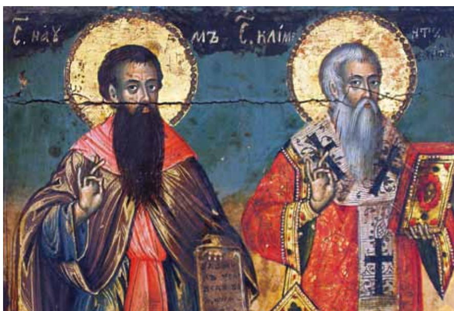
сл. 11 Св. Наум и св. Климент Охридски, детаљ од иконата Богородица со Исус Христос и светители

ликовите на св. Наум и св. Климент Охридски упатува на нејзиното охридско потекло, односно