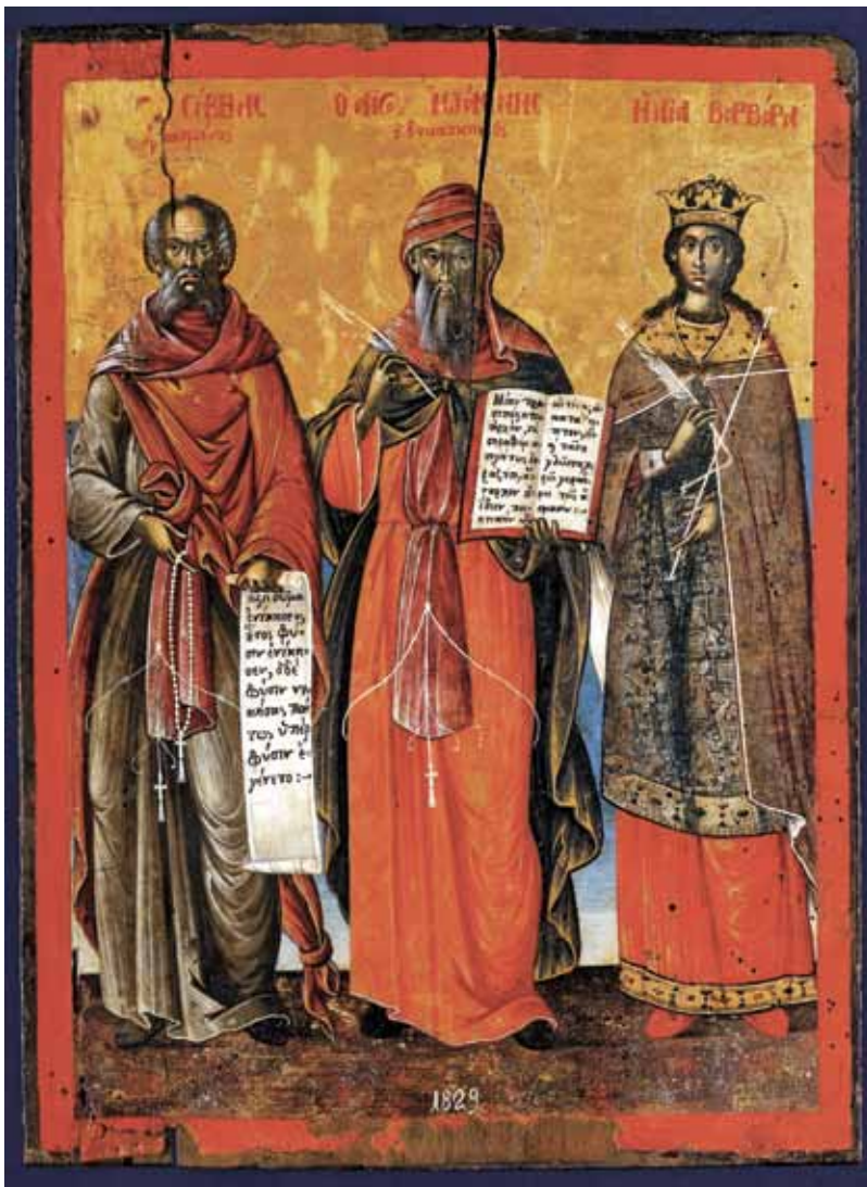
сл. 12 Св. Сава, св. Јован Дамаскин и св. Варвара, 1829 г., икона од цр. Свето Благовештение во Тирана