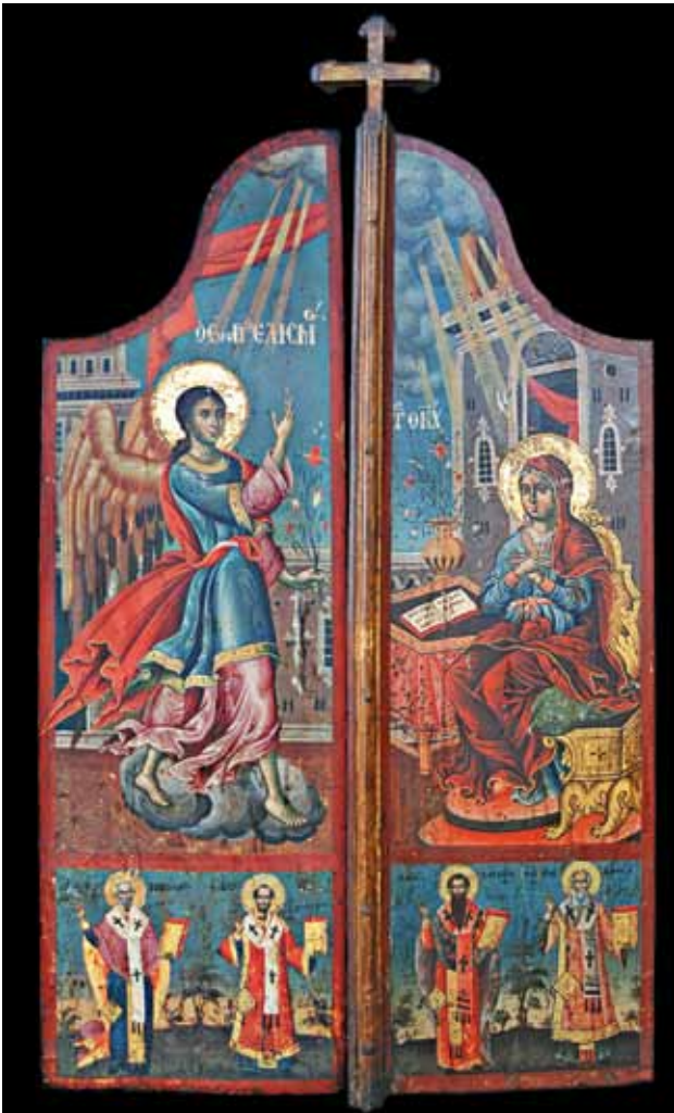
сл. 8 Царски двери, 1827 г., цр. Св. Димитриј, Охрид