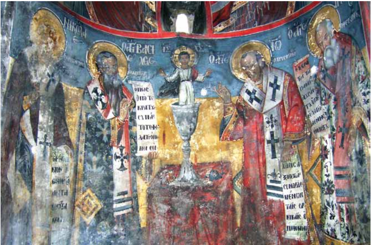
сл. 7 Поклонување на Агнецот, 1827 г., олтарна апсида на цр. Св. Димитриј во Охрид