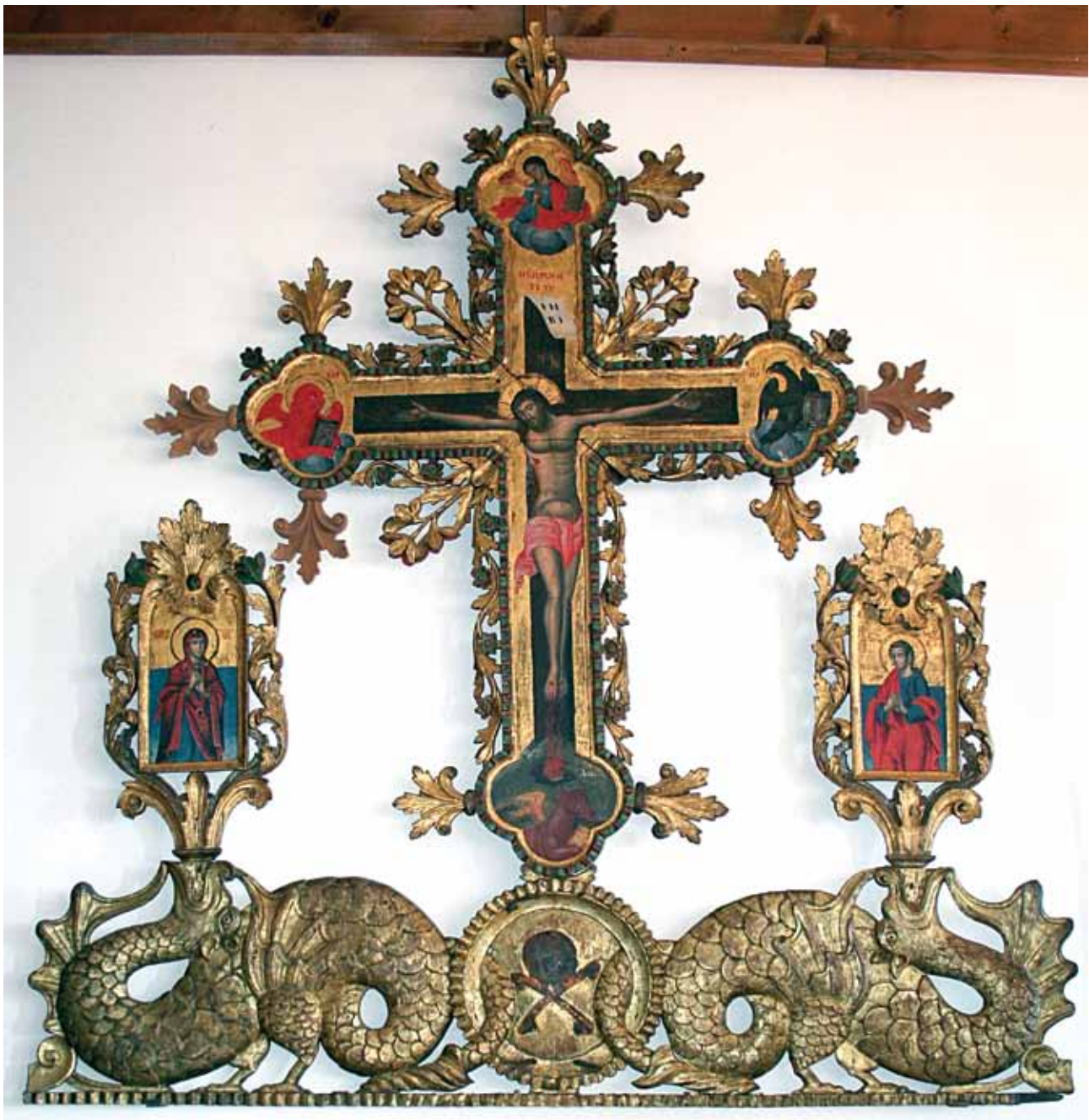
сл.9 Крст-Распение, околу 1827 г., експонат во куќата на Робевци, Охрид