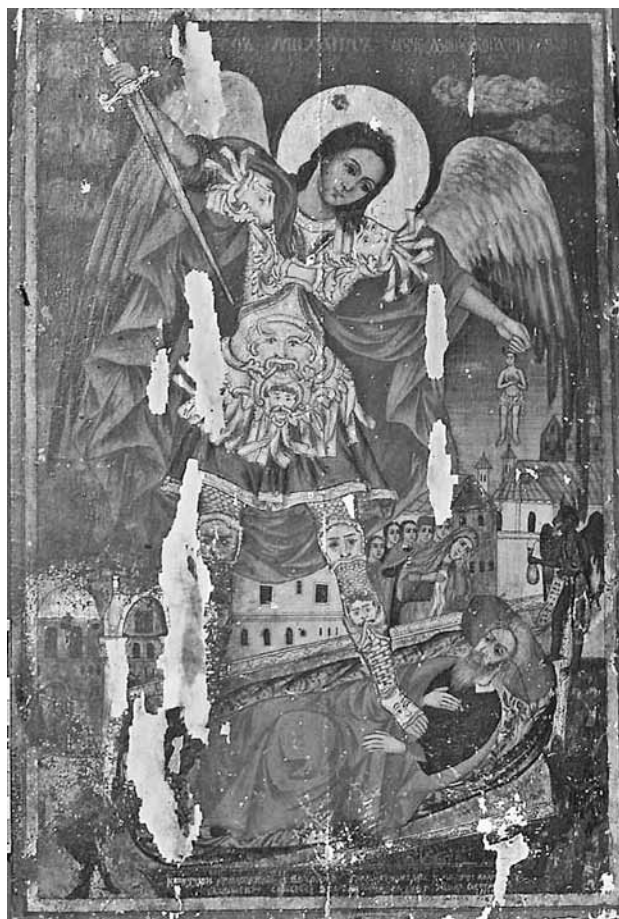
6. Архангел Михаил мъчи душата на богатия Лазар. Икона в чипровската църква „Възнесение Христово”.

прелъстява Адам и Ева; Адам и Ева ядат от забранения плод; в долния ред – Бог укорява Адам и Ева, а те се посрамват; Бог пита Адам кой го прелъсти, Адам отговаря: жената, която си ми дал; Бог пита Ева кой я прелъсти, Ева отговаря: краса; Изгонване на Адам и Ева от рая; Ангел учи Адам и Ева да работят. Същите 12 сцени намираме и в иконостаса в църквата на с. Горна Лука, работен непосредствено след чипровския, както и в църквата на с. Гаганица. Сцените са придружени от дълги надписи. Прави впечатление, че този цикъл е по-подробен отколкото се предписва в Ерминията на Дионисий от Фурна, най-разпространеният зографски наръчник в тези времена 17 . Възниква въпросът - какъв е източникът на Данаил Щиплията. Дали той е донесъл със себе си от родните си места или от мястото, където е обучен, знания за състава на цикъла и надписите към съ-