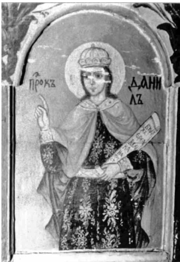
5. Пророк Данаил. Пророчески ред в иконостаса в църквата „Арх. Михаил” в с. Копиловци. 1876 г.