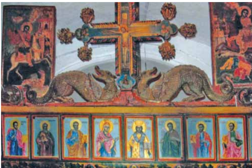
3. Горна част на иконостаса в чипровската църква „Възнесение Христово” 1866 г.