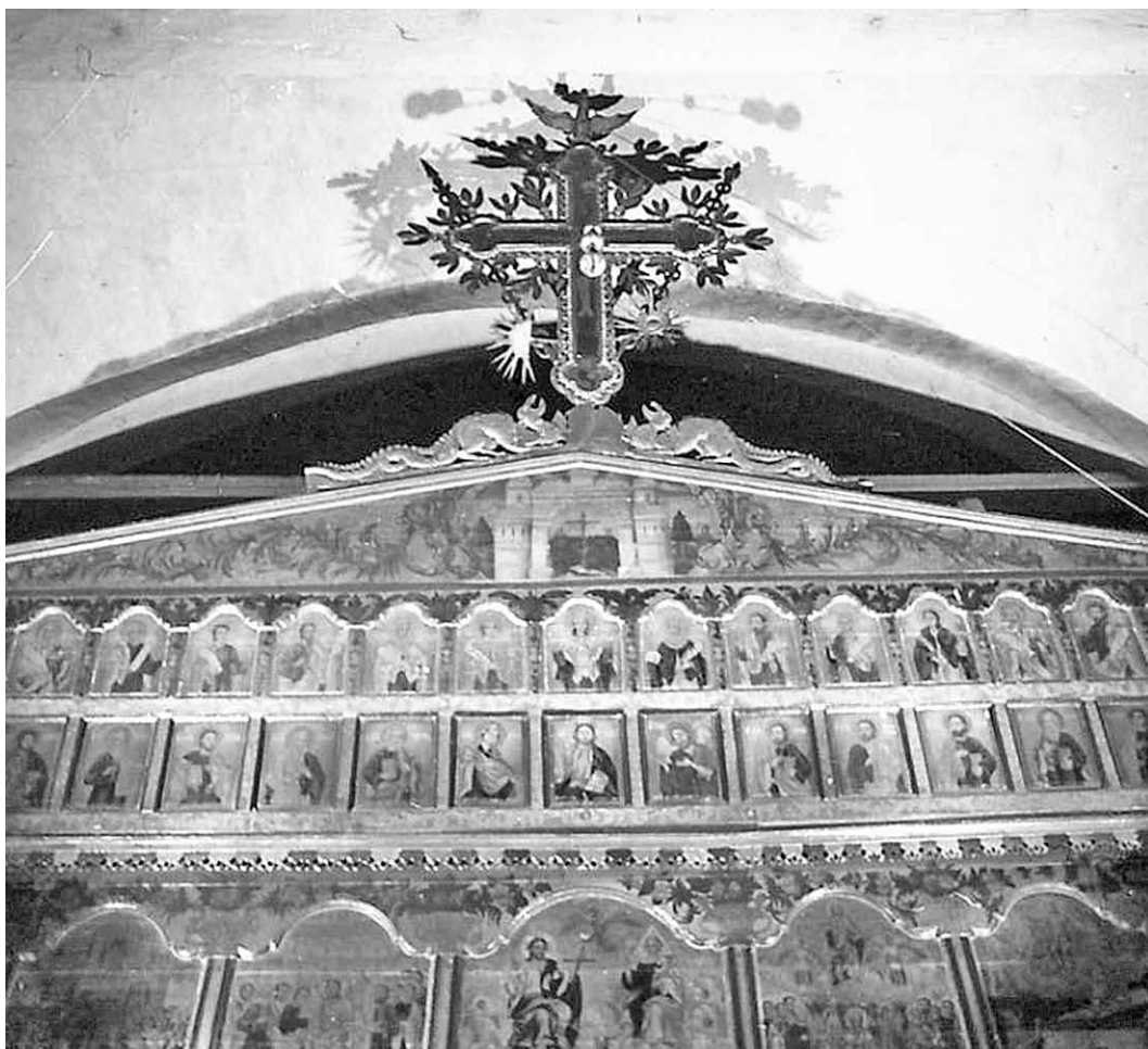
7. Иконостас в църквата „Архангел Михаил” в с. Копиловци. 1876 г.