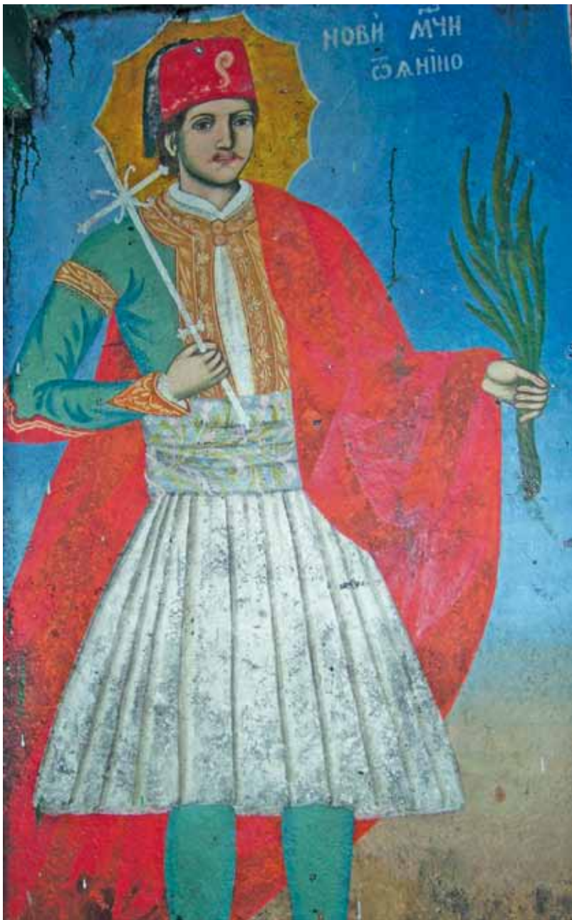
8. Св. Георги Нови Янински. Стенопис в църквата „Архангел Михаил” в с. Копиловци. 1876 г.

Данаил, е наличието на пророчески ред, в центъра на който е поместено изображението на Богородица оранта, сигнирана „Знамение на небеси” (в Горна Лука 1867 и Копиловци 1876). Пророческите иконостасни редове се срещат рядко на Балканите. Подобно рядко изключение е фризьт от Карпинския манастир от XVI в., илюстриращ темата Пророците те предвестиха 23 . Пророчески редове с изображение на Богородица Знамение в центъра, са характерни за руския висок иконостас, от където вероятно проникват в Румъния. От