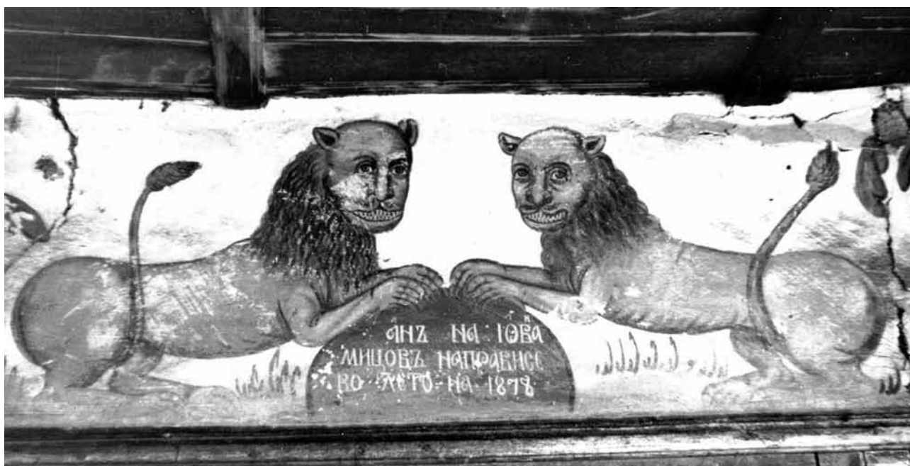
12. Стенопис в хана на Йован Мицов в с. Бели Мел, Чипровско. 1878 г.

често или Методий, или и двамата са облечени като архиереи). Подобно представяне на Кирил и Методий като монаси намираме в творби на самоковски зографи от Доспейския род: стенописите на Захари Зограф в църквата на Троянския манастир (1847) 44 , икона на Станислав Доспевски в софийската църква „Св. Неделя“ (1867) 45 , икона в Рилския манастир от Иван Доспевски (1885) 46 . Перото в ръката на Методий и текстът на свитъка на св. Кирил вероятно са инвенция на зограф Данаил. Не мога да посоча паралел и на надписа „моравски учители“. Във всеки случай поне от средата на XIX в. подробностите от живота на двамата светци и специално тяхната моравска мисия са били достатъчно добре известни. В сравнение с обичайните надписи: „Просветители/учители на славяните/българите“ този надпис е много по-конкретен и близък до историческата истина. Образите, които рисува зограф Данаил, са твърде характерни и лесно разпознаваеми. Лицата са издължени, със заострени брадички. Фигурите в иконите са добре пропорционирани, а в стенописите по-често са скъсени. Специфично е оформянето на фоновете на светците в цял ръст в стенописите, където зографът рисува детайлни или по-пестеливи пейзажи. Данаил има особена склонност към бароковия по тип орнамент, който запълва пространствата около медальоните в долната част на иконостасите, лозниците, както и