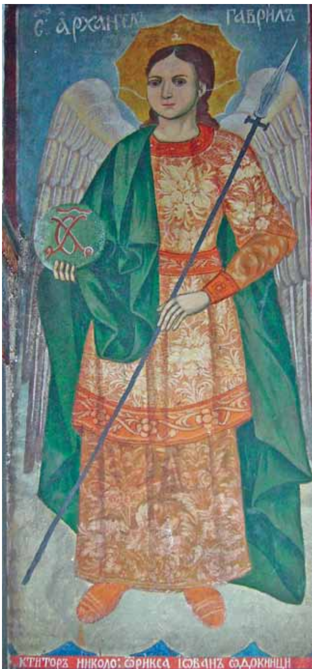
10. Архангел Гавриил. Стенопис в църквата „Архангел Михаил” в с. Копиловци. 1876 г.

щампата, изпълнена от светогорския йеромонах Даниил 30 . Възможно е, разбира се, зографът да е повлиян от някоя живописна реплика на графичното изображение. В повечето живописни и графични изображения на сцената надписът е само „Архангел Михаил мъчи душата на богатия” 31 , а в чипровската икона Данаил е добавил името Лазар. Когато в края на XVIII в. композицията се обогатява и конкретизира, тя се свързва с притчата за богатия (Лука 12:16-21), като връзката се потвърждава от надписи - цитати, изписвани в