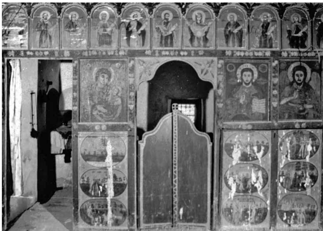
4. Иконостас в църквата „Възнесение Христово” в с. Горна Лука, Чипровско. 1866-1867 г.

1873 г. икони в църквата „Св. Георги” в с. Ранченици, Светиниколско;