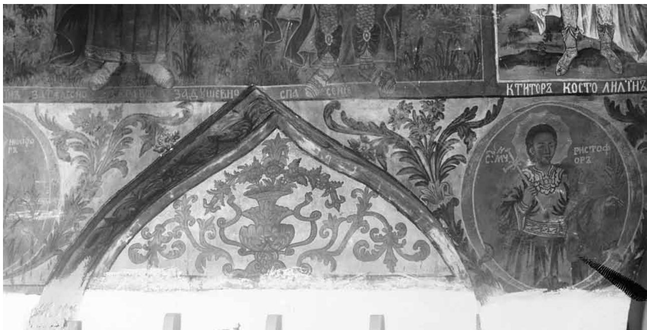
11. Интериор на църквата „Възнесение Христово“ в гр. Чипровци. Стенописи от 1877 г.

ността този вариант на сцената Архангел Михаил мъчи душата на богатия да е създадена в Македония, откъдето Данаил Щиплия я е усвоил.