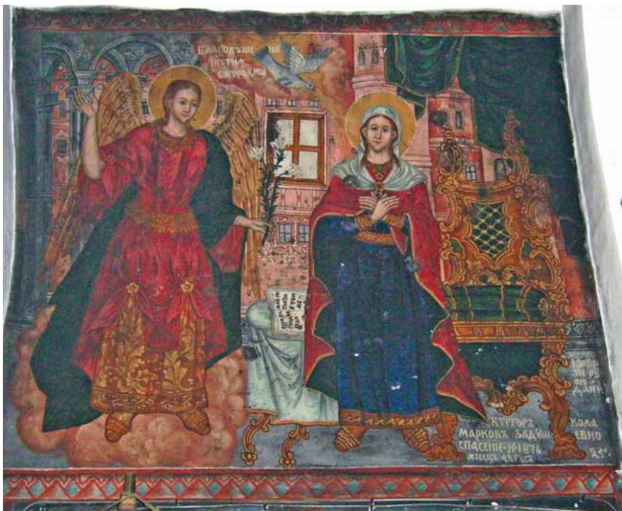
9. Благовещение. Стенопис в църквата „Архангел Михаил” в с. Копиловци. 1876 г.