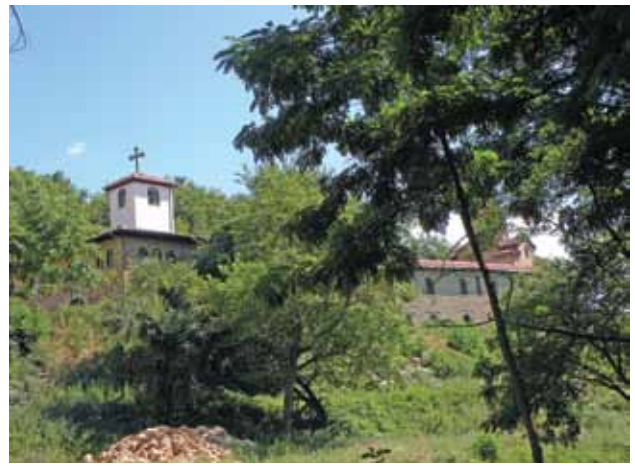
3. Манастирот денес