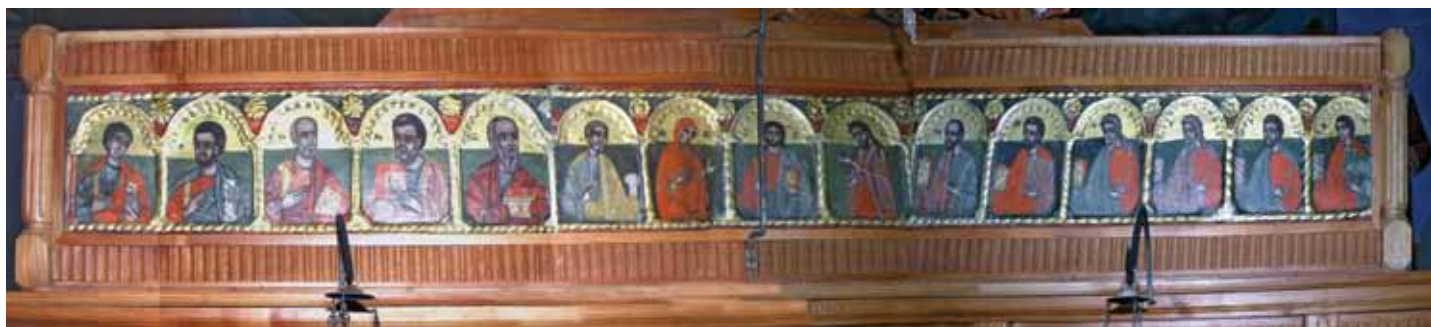
11. Чинот со Апостоли