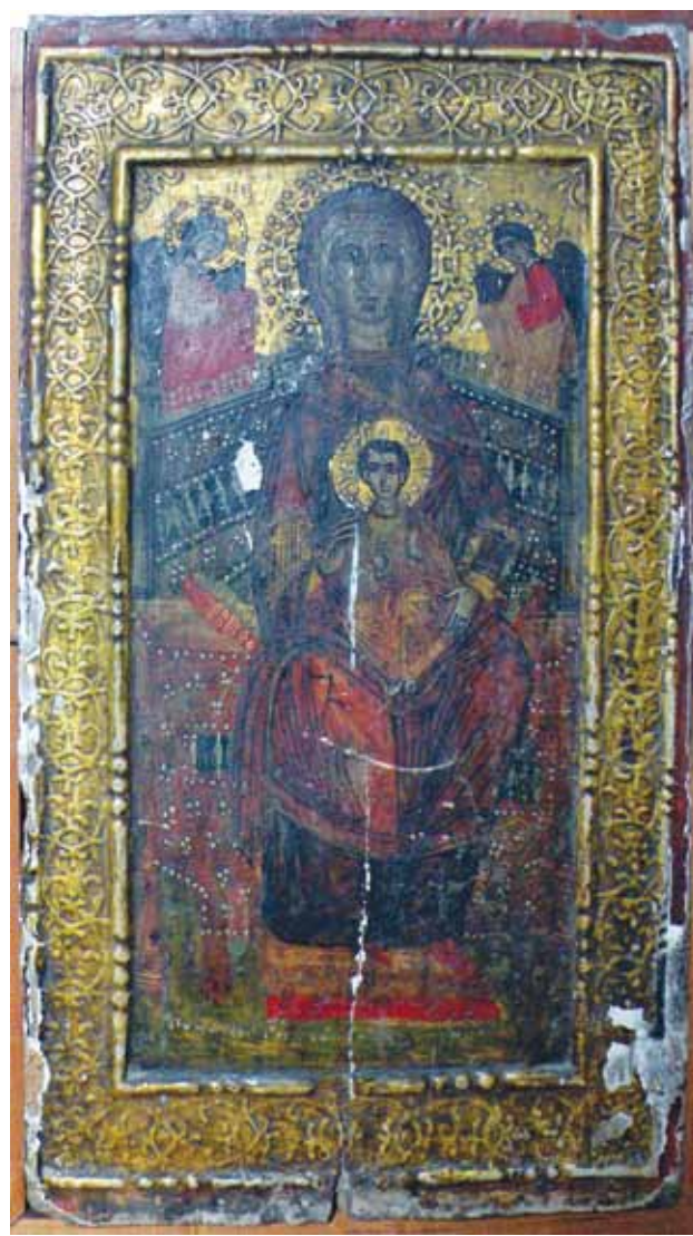
14. Икона на Св. Богородица со малиот Христос на престо- XVII век

Станува збор за икона со претстава на Деисис, односно насликан е Исус Христос седнат на престо со отворено евангелие во левата рака, а со десната благословува.