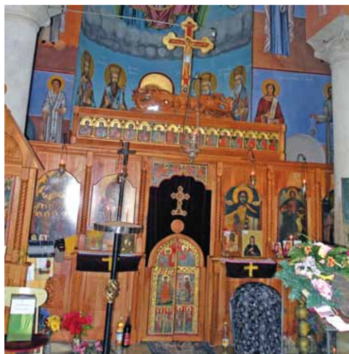
10. Иконостасот во црквата „Св. Спас“