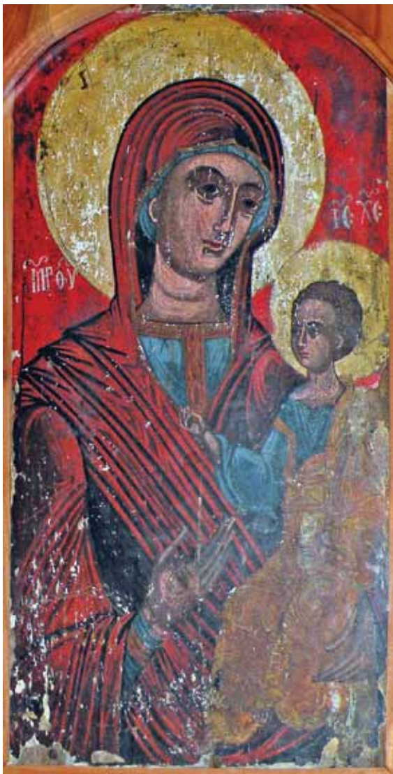
13. Икона на Св. Богородица со Христос, II половина на XVI век ?