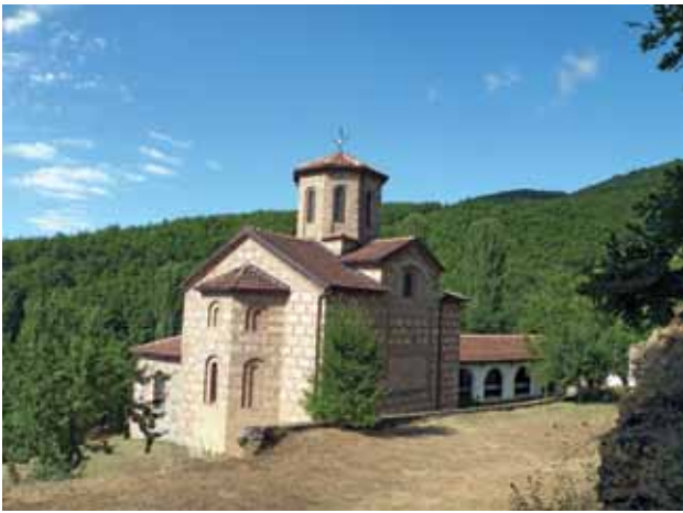
1. Црква „Св. Спас“, с. Горно Лакочереј