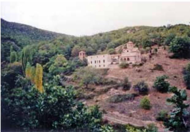
2. Манастирот во 80-те години на XX век