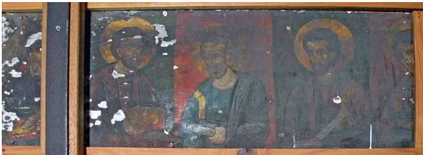
15. Чин со Апостоли, II половина на XVI век ?, детал;