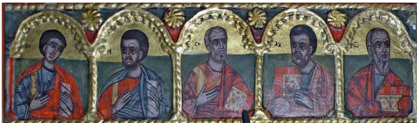
16. Чинот со Апостоли- XVII век, детал;