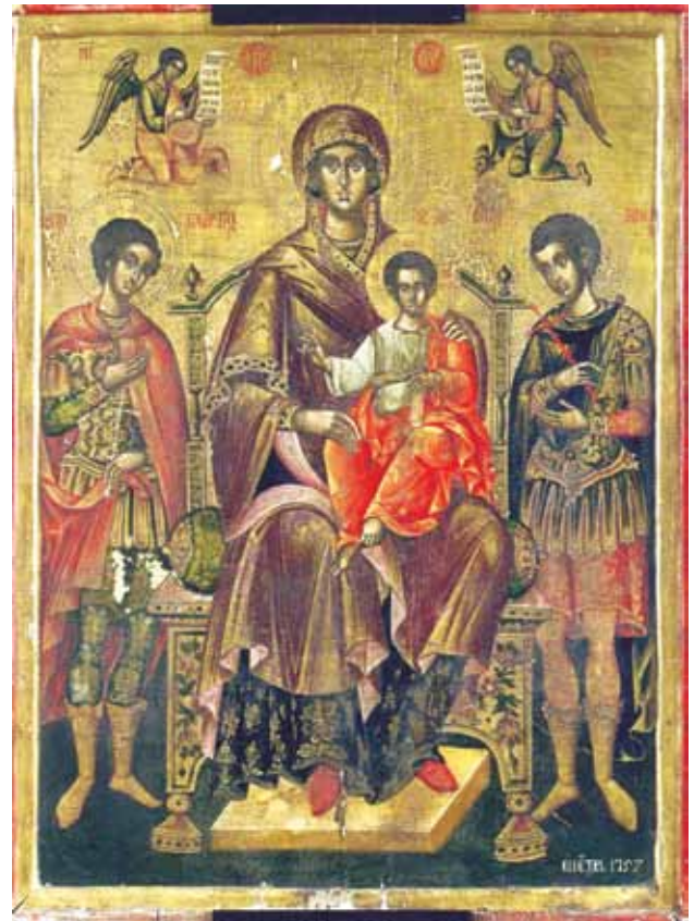
Сл. 4. икона, Богородица со Христѝос, св. Горѓиј и св. Димитриј, манастир Св. Јован Рилски, 1757 г.

наведуваме иконата на св. Петка од црквата Св. Герман на Преспа, каде што зографите Атанас и Константин ги остваруваат раните, почетни дела во својата долга сликарска кариера. Иконата неодамна беше за првпат објавена и атрибуирана како дело на оваа сликарско ателје. 6