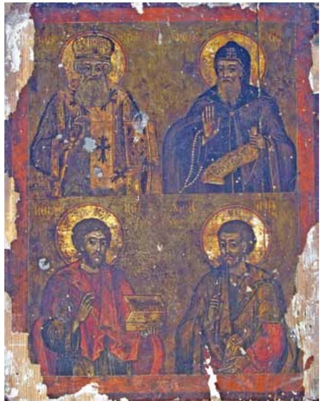
Сл.10. икона, св. Аџанасиј Александриски, св. Анџониј, св. Кузман и Дамјан, црква Св. Аџанасиј, с. Јаѓол Доленци, 1780 г.

зина на манастирот Ивирон, е основан во 1730 г. додека главниот католикон е изграден во 1779 г. 19 Не е исклучена можноста монахот Паисиј да бил еден од подвижниците во братството на скитот на Св. Ана.