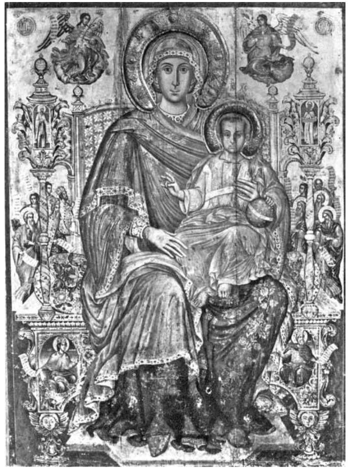
Сл. 2. икона, Богородица со Христос, црква Богородица Живоносен источник, Корча, 1752 г. (сѵред Th. Popa)

на Богородица и Христос, широко отворените очи подвлечени со тенка линија, светлозелениот инкарнат со благи црвени нијанси и тонови, наборите на раскошниот мафорион што ја следат линијата на телото и раката придонесуваат за една нагласена монументалност. Стремежот кон декоративноста на формите е изразен со сликање на ѕвездите на мафорионот, како и тенките златни препендули на надлактицата на десниот ракав.