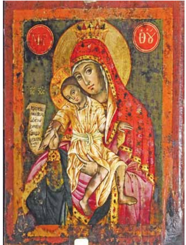
Сл.12. икона, Бо̀ородица Елеуса-Кикоска, галерија на икони во Прилеп, вѝора ѿоловина на XVIII век.

на XVIII век. 20 Како стигнала иконата во црквата во Ботун засега останува непознато. Врските на нашите манастири и верници со манастирите на Атос во XVIII и XIX век се интензивираат, што се потврди и со откривањето на поголемиот број графички икони во црквата Св. Димитриј во Прилеп, 21 па најверојатно и иконата во Ботун е донесена од Света Гора и самиот скит на Ивиронскиот манастир. Од друга страна, не смееме да ја отфрлиме и можноста, што често се потврдува при теренските проверки на црквите, ова графичка икона да припаѓала на некоја друга црква и оттаму да е донесена во црквата во Ботун.