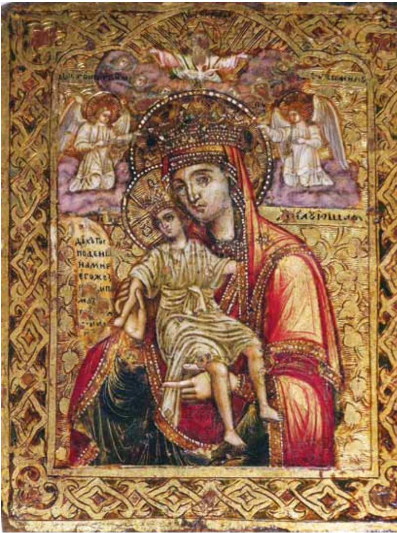
Сл.13. икона, Богородица Милујашица, галерија на икони Прилеп, крај на XVIII почеток на XIX век.

та – 1780-та, е испишана под претставата на александрискиот архиепископ.