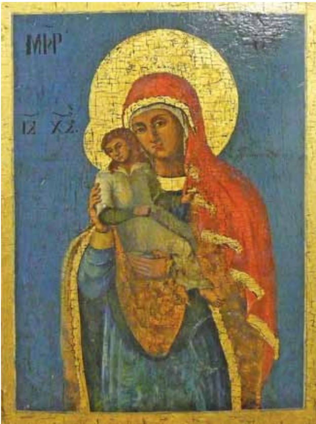
Сл. 14. икона, Богородица Елеуса-Кикоска, збирка на икони, Музеј на Македонија, Скопје, прва половина на XIX век

но во графичката продукција и хартиените икони настанати на Света Гора во овој период. 26 Но старото култно средиште од кадешто се ширел култот на Богородица Кикос е истоимениот манастир на островот Кипар. Преданијата, кои наоѓаат потврда во историските извори, говорат за византискиот цар Алексеј I Комнен (1080-1118) како основач и ктитор на манастирот, заедно со дуксот на островот Кипар Михаил Вутаминат. 27 Во негово време се гради манастирот и чудотворната икона од Цариград и црквата во Влахерна се пренесува на Кипар во нејзиниот манастир, од каде што во следните векови ќе зрачи и ќе се шири најзиниот култ, а иконографскиот тип ќе биде основа за оформување на иконографски типови на Богородица со различни епитети (Фобриотиса, Портаитиса и Аксиос Естин) 28