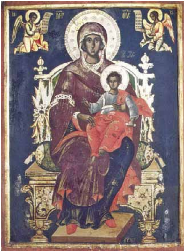
Сл.3. икона, Богородица со Христѝос, манастир Св. Јован Рилски, 1757 г.