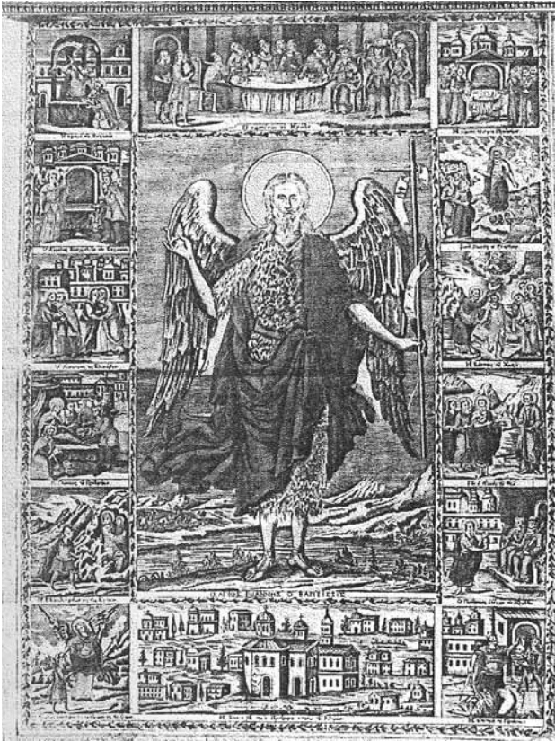
Сл.9. харџиена икона, св. Јован крстител со сцени од живото, скип Св. Ана, манастир Ивирон, 1793 г. (според D. Papastratos)

може да се следи само на одредени делови, ни ја открива провиниенцијата на иконата, ктирорите и побудите што ги поттикнале на овој ктиторски потфат.