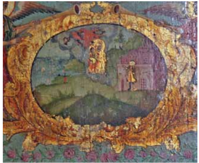
Фиг.5. Чудото със спасението на затворника