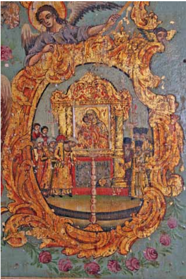
Фиг.6. Чудото с изцелението на жената с влошено зрение

Според преданието, иконата на Богородица Хрисороятиса била нарисувана от св. евангелист Лука и по време на иконоборския период (726-843 г.) била хвърлена в морето при Исаврия в Мала Азия от благочестива жена, за да я предпази от унищожаване. Така иконата достигнала до брега на Пафос в Кипър и там била намерена от монаха Игнатий. Заедно със своите братя отшелници той я пренесъл в една пещера и изградил параклис, около който с течение на времето възникнали други постройки и така се създал манастир, посветен на Богородица “Хрисороятиса”, който съществува и до днес 6 . Вляво на иконостаса от 1770 г. се намира чудотворната иконата на Богородица Хрисороятиса, покрита със сребърна обкова от 1761/62 г. 7 . Някои от изобразените чудеса с иконата на Бо-