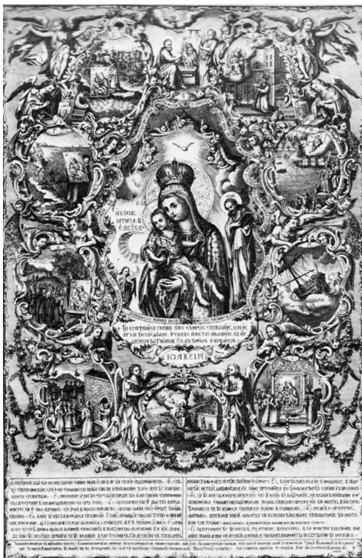
Фиг.9. Халкография на Богородица Хрисороятиса със сцени от историята на едноименната икона (1801 г.), зограф Йоанис Корнарис

графия е дело на прочутия през втората половина на XVIII в. критски зограф Йоанис Корнарос 17 , който създава зографска школа в Кипър 18 . Ловешката икона се различава от халкографията (1801 г.) само по два второстепенни детайла. Първият е, че в бароковата рамка под надписа на Богородица