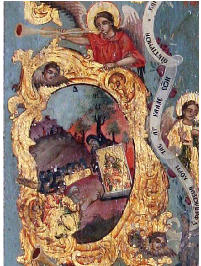
Фиг.3. Монасите последователи на Игнатий построяват храм за иконата на планината Роя

Около централното изображение на Богородица Елеуса са поместени десет сцени от историята на самата икона на Богородица Хрисороятиса, подредени по хронологичен ред. От тях девет са поместени в медальони с рамки в бароков стил. В центъра на горната част на иконата е изобразена сцена, която не е вместена в медальон 1. Св. Лука рисува една от 70те икони на Богородица, вдъхновен от божие пратеничество на ангела Господен, който указва начина на нейното изобразяване. Останалите сцени, които са изписани в медальони, започват от горната лява част на рамката 2. През иконоборския период благочестива жена спасява иконата от унищожение, като я хвърля в морето при Исаврия и тя стига до Кипър 3. Монах Игнатий намира иконата и я пренася на планината Роя 4. Монасите последователи на Игнатий построяват храм, където поставят иконата (фиг. 3). 5. Еретичка опитва да влезе в храма, но е възпряна от ангел с горящ меч. Едва след като се покайва и изповядва успява да влезе в храма (фиг.4) 6. Православен незаслужено обвинен и хвърлен в затвор в Пафос, не се отказал от вярата в Христос и бил спасен от Богородица, която му изпратила