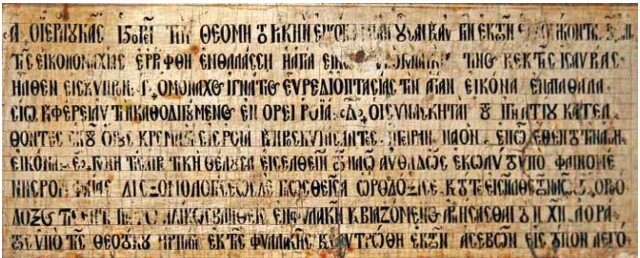
Фиг.7. Надпис в долната част на иконата на Богородица Хрисороятиса (ляв детайл)