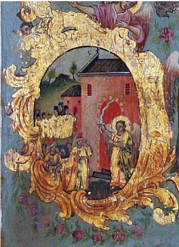
Фиг.4. Чудото с еретичка която се опитала да влезе в храма

ΟΥΣΑΝ Κ(ΑΙ) ΑΥΤΗΝ ΕΚ ΤΩΝ ΕΒΛΟΜΗΚΟΝΤΑ Β. ΕΠΙ / ΤΗΣ ΕΙΚΟΝΟΜΑΧΙΑΣ ΕΡΡΙΦΘΗ ΕΝ ΘΑΛΑΣΣΗ Η ΑΓΙΑ ΕΙΚΩΝ ΥΠΟ ΓΥΝΑΙΚΟΣ ΤΙΝΟΣ Κ(ΑΙ) ΕΚ ΤΗΣ ΙΣΑΥΡΙΑΣ / ΗΛΘΕΝ ΕΙΣ ΚΥΠΡΟΝ : Γ. Ο ΜΟΝΑΧΟΣ ΙΓΝΑΤΙΟΣ ΕΥΡΕ ΔΙ' ΟΠΤΑΣΙΑΣ ΤΗΝ ΑΓΙΑΝ ΕΙΚΟΝΑ ΕΝ ΠΑΡΑΘΑΛΑ/Σ(С)ΙΩ