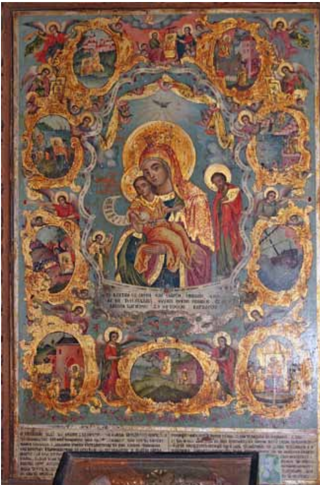
Фиг.1. Икона на Богородица Хрисороятиса със сцени от историята на едноименната икона от църквата „Св. Богородица“ в Ловеч

В църквата „Св. Богородица“ (1834 г.) в горната част на кв. „Вароша“ в Ловеч върху дърворезбен проскинитарий в притвора на храма, вдясно от вратата към наоса, е положена икона на Богородица Елеуса с Младенеца. Иконата е с размери 80 x 110 см и е запазена в отлично състояние (фиг.1). В центъра на иконата е изобразена Богородица с Младенеца (фиг.2), облечена в тъмносин химатий и розов мафорий, а главата и е покрита с охровозлатист плащ, върху който носи корона. Сигнирана е с епитет, изписан с червени главни гръцки букви: Μ(ΗΤΗ)Ρ / Θ(ΕΟ)Υ / Η ΧΡΥΣΟΡΟ/ΛΑΤΙΣΣΑ Η / ΕΛΕΟΥΣΑ . Младенецът Христос Ι(ΗΣΟΥ)Σ Χ(ΡΙΣΤΟ)Σ , седнал в ръцете на Богородица, е с протегнатата встрани лява ръка, докато в дясната държи развит свитък, на който е изписан текст на църковнославянски 1 : Д(У)ХЪ / Г(ОСПО)ДЕН /