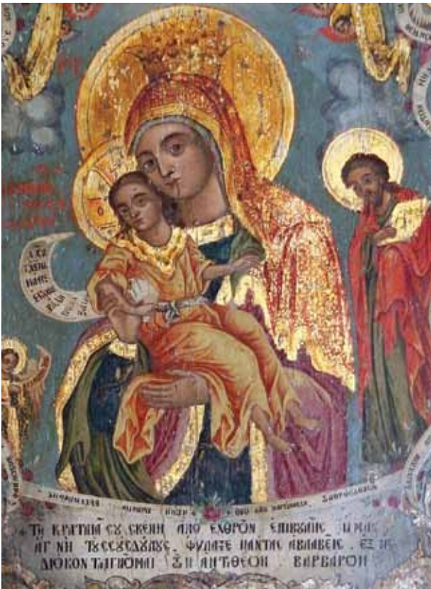
Фиг.2. Икона на Богородица Хрисороятиса (детайл)

COYΣ ΔΟΥΛΟΥΣ, ΦΥΛΑΤΤΕ ΠΑΝΤΑΣ ΑΒΛΑΒΕΙΣ, ΕΕ ΗΣ / ΔΙΩΚΟΝΤΑΙ ΓΝΩΜΑΙ ΤΩΝ ΑΝΤΙΘΕΩΝ ΒΑΡΒΑΡΩΝ (фиг. 2). Под надписа в барокова рамка са представени в миниатюрен вариант три херувима.